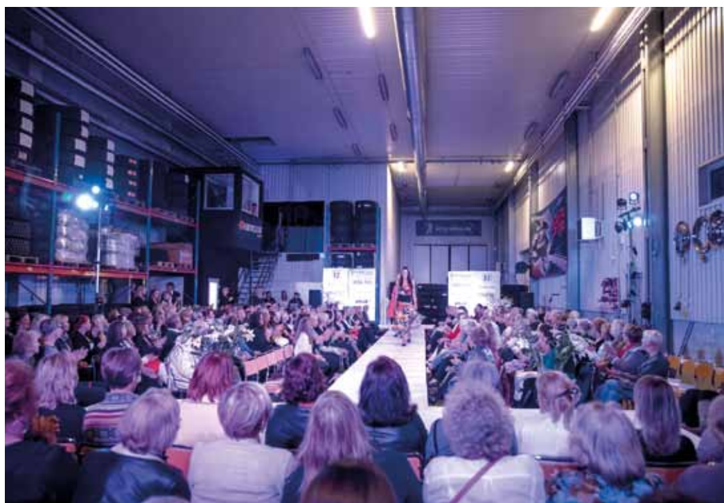
Den modeshowen som arrangerades hos Ulrix i Malmö drog stor publik. Pengarna som kom in skänktes till bröstcancerforskningen vid Lunds Universitet.