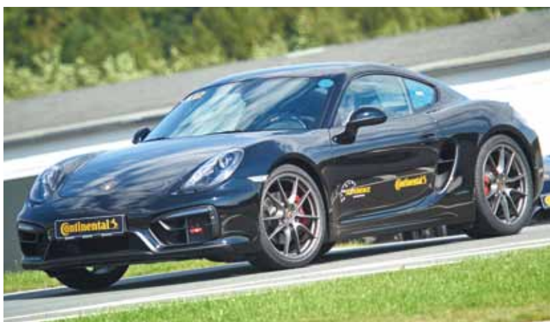
Porsche Cayman GTS var en av de bilar Continental använde för att visa vad nya Sport Contact 6 går för. Däcket kommer i 41 dimensioner upp till 23 tum, bland annat en variant anpassad för elbilen Tesla.

Sport Contact 6 kommer i 41 dimensioner som börjar på hela 19 tum(!) – 225/35 ZR 19 – och går upp till 23 tum – 315/25 ZR 23. Det kan jämföras med det första ”ContiSportContact” som kom 1994. Det hade storlekar som började på 13 tum och slutade inte långt från där SP 6 börjar – på 20 tum.