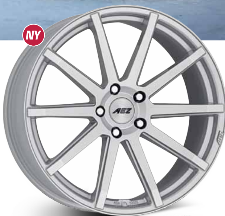
AEZ STRAIGHT shine 17 - 20"

Se hela vintersortimentet på vår hemsida: www.oclbrossons.se/vinter