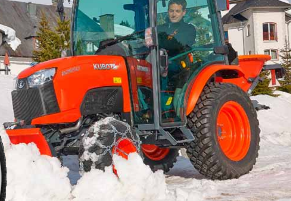
Galaxy Garden Pro