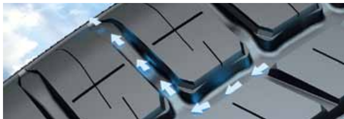
De avfasade hörnen i de inre klackarna svarar för Coanda-effekten som accelererar vattenavledningen från mittspåren och ut genom sidospåren.

(210 km/t). De dimensioner som klassats som AA i våtgrepp och rullmotstånd är 195/65 R 15 95 H XL, 185/60 R 15 88 H XL, 185/65 R 15 92 H XL, 215/60 R 16 99 W XL och 205/55 R 16 94 W XL.