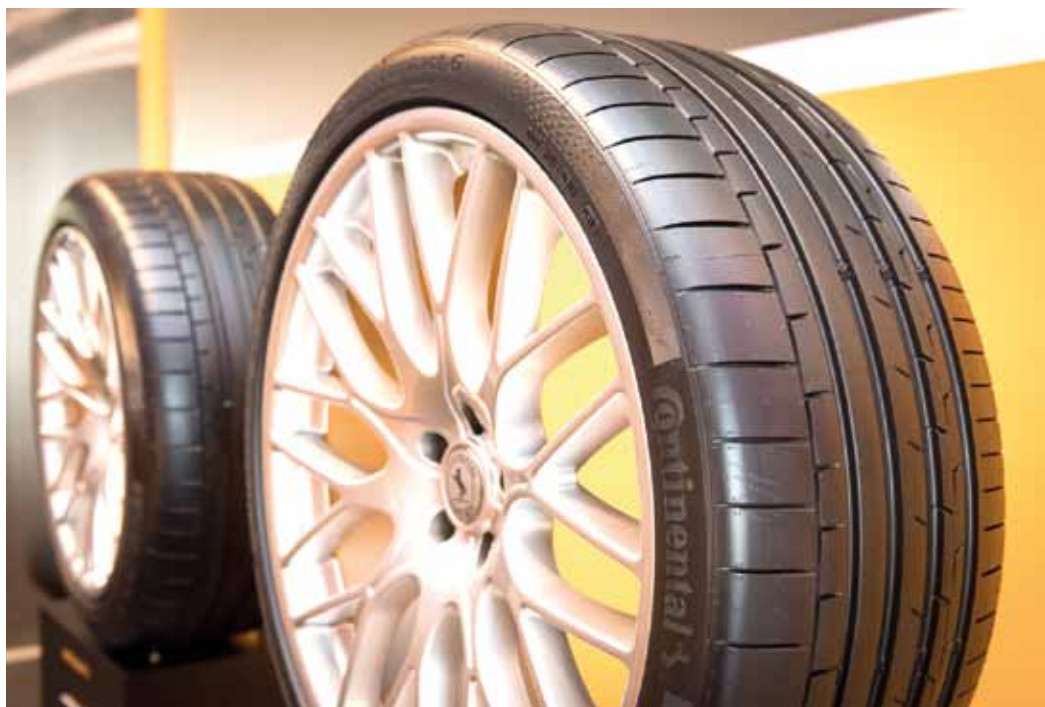
Sport Contact 6 har ny "Black Chili" gummiblandning som ska ge maximalt väggrepp. Asymmetriska skuldror med mönsterblock som låser sig ska ihop med de olikformade mittribborna ge direkt styrrespons.

Nu lanserar Continental sitt nya högfartsdäck, Sport Contact 6. Det ersätter Sport Contact 5, är godkänt för 350 km/t och (naturligtvis) överlägset föregångaren i allt. Däcket är avsett för rena sportvagnar och sportiga standardbilar. Honda har till exempel redan bestämt sig för att originalutrusta däcket på sin Civic Type R och har med Sport Contact 6 slagit varvrekord på Nürburgring. Vi har provat nyheten i Tyskland.