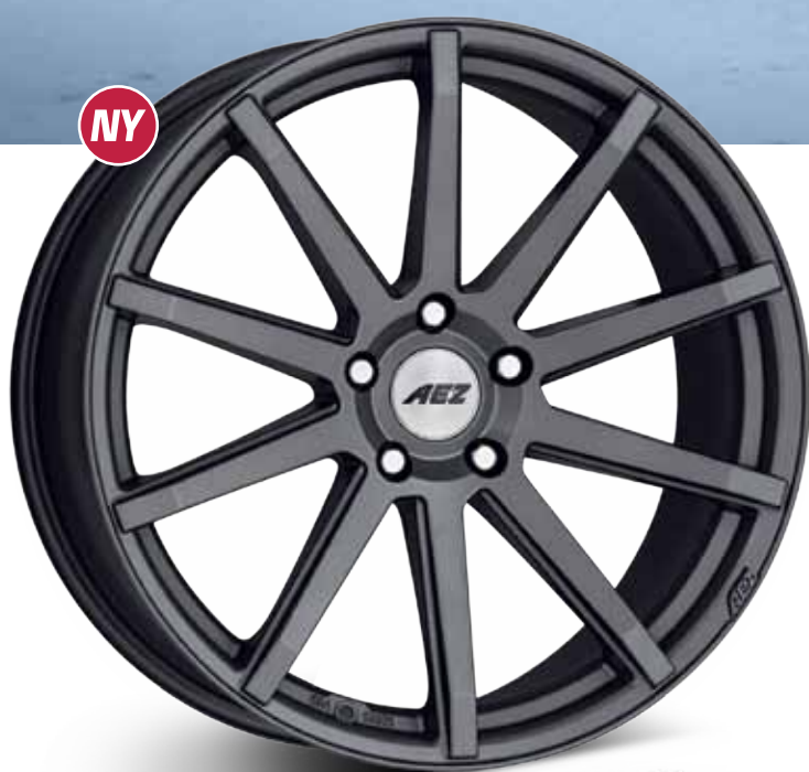
AEZ STRAIGHT dark 18 - 20"