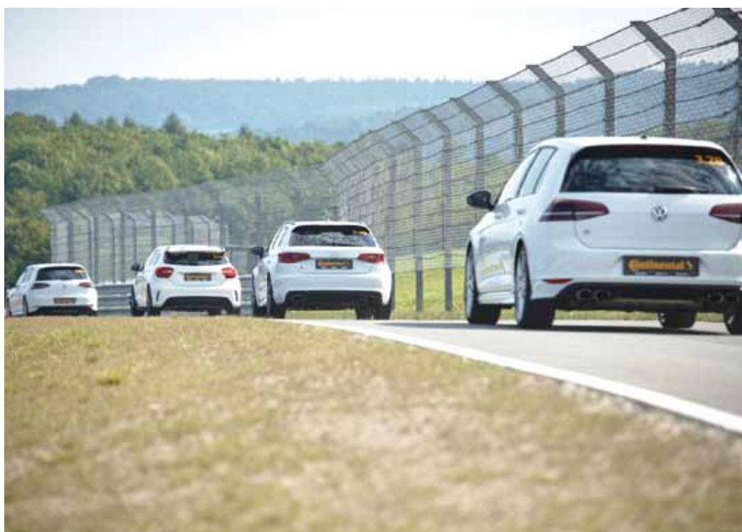
Pressen fick prova det nya däcket på en krävande men rolig bana nära Bad Driburg i Tyskland. Handlingprovet (väghållningen) gjordes med Audi RS3, Mercedes A45 AMG och VW Golf R.

Vi håller till på den privatägda racerbanan Blister Berg i mellersta Tyskland och ska strax känna Sport Contact 6 på pulsen i det första provet, som ska visa däckets respons på styrutslag. Kvällen före har vi med tysk grundlighet matats med ingående tekniska beskrivningar av Contis nya stolthet, och nickat på lämpliga ställen för att låtsas begripa mer än vi kanske gör.