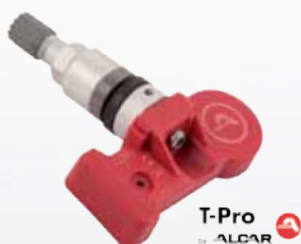
ALCAR T-Pro 58% täckning

96% täckning med TPMS sensorer från OCL Brorssons