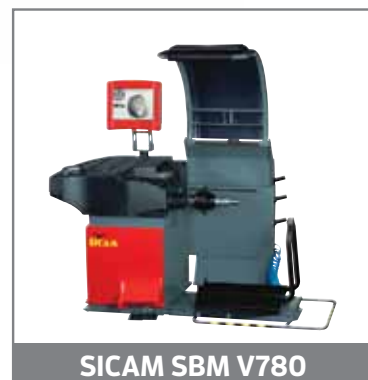
SICAM SBM V780