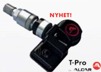
ALCAR T-Pro 1 8% täckning