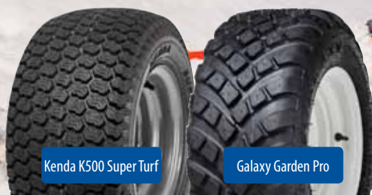
Kenda K500 Super Turf