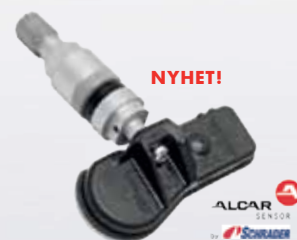
ALCAR by Schrader 65% täckning

Logga in i webshopen för att se aktuell kampanj!