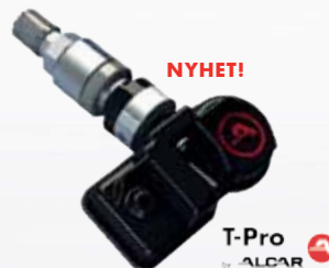
ALCAR T-Pro 2 (LOS/PAL) 30% täckning