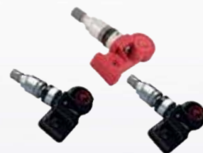
ALCAR T-Pro, T-Pro 1, T-Pro 2 96% täckning