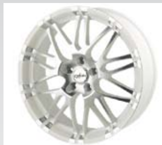
Oxrock kommer från Oxigin och är polerad white pearl. Den finns i 18, 19 och 20 tum.