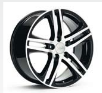
Mauritius Black kommer från DBV och har fem dubbelekrar med svarta sidor på svart fälgbana. Finn i 17, 18, 19 och 20 tum.