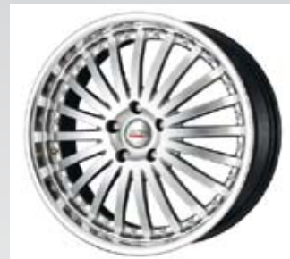
Arena från Moda i Italien är en silverfärgad fälg med lös kromad fälgkant. Fälgen finns i 20, 21 och 22 tum.