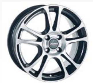
Från Autec kommer även denna fälg i designen Limit svart och är anpassad för mindre bilar. Finns i 15 och 16 tum.