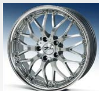
Zito Milano är i svart lack med olivgröna ekrar. Finns i 18 och 19 tum.