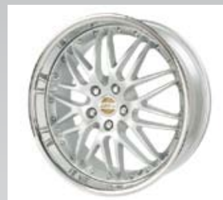
Victoria kommer från GMP och är silverfärgad fälg med lös kromad fälgkant. Fälgen finns från 18 till 22 tum.