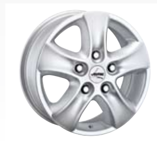
Autec T finns i 15 och 16 tum och är anpassad till bland annat Fiat Ducato och Ford Transit.