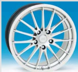
Enkei Komaki är i silverfärg med polerad kant och finns i 17 tum.