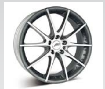
AEZ Tidore dark har delvis en polerad framsida på ekrar. Finns från 16 till 19 tum.