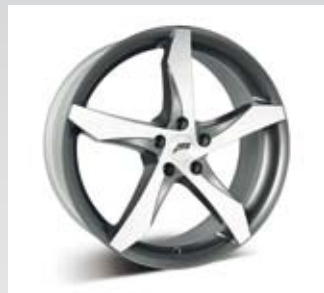
AEZ Lascar har delvis polerad framsida på ekrar. Finns från 17 till 20 tum.