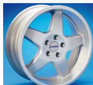
Denna robusta fälg i silver metallic från Eiker är en klassiker för Volvo-älskare och finns i 17 tum.