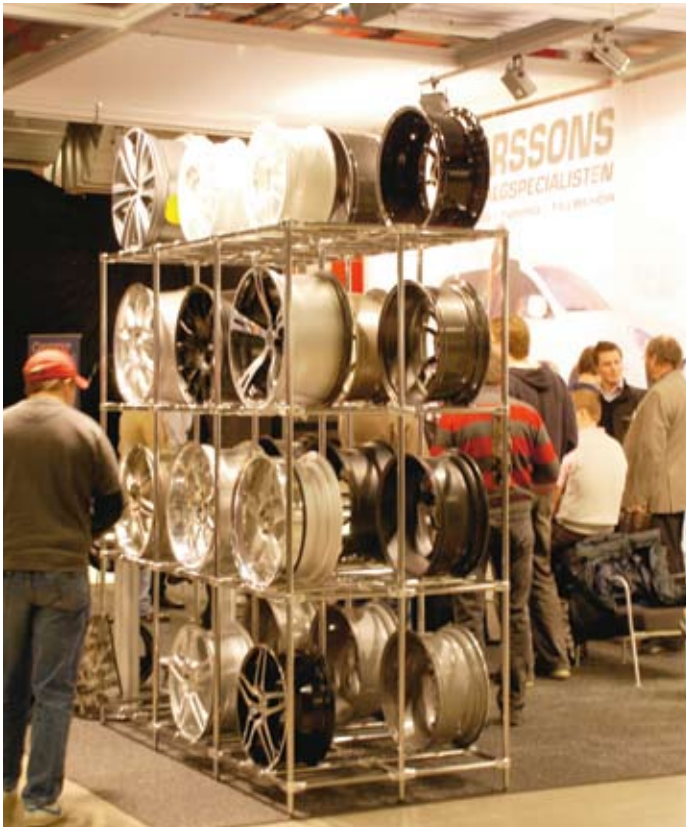
Det var knappt att utställningslokalerna hos Scandic Infra City räckte till när de 15 leverantörerna till Däckteam ställde ut.