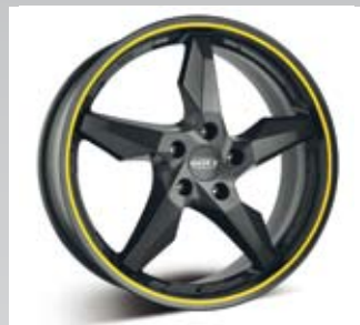
Dotz Touge graphite är en helt lackerad mattsvart fälg. Finns från 16 till 19 tum.

— Det är från guld till vitt. Det som är utmärkande är att det är mer design i fälgarna och flera färger inblandande, säger han. Någon tydlig trend finns inte utan det som har gällt under de senaste åren har nu utvecklats vidare.