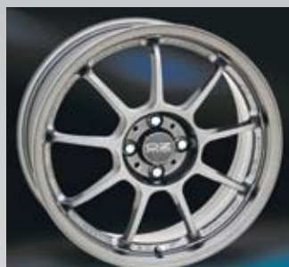
O.Z. Alleggerita är en helgjuten lättviktsfälg i Titanium mirror och finns i 17 och 18 tum.

— Det som utmärker vårens fälgar är färgläggning och polering, fortsätter han. För att visa fälgarna i rätt miljö har vi gjort om vår hemsida och gjort den mer tillgänglig både för våra återförsäljare och slutkunder. Återförsäljaren kan lätt visa kunden vilka fälgar det är som passar deras bil.