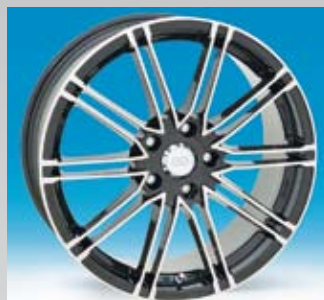
Enkei Misawa är en blank svart fälg med polerad front. Finns i 17 och 18 tum.