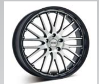
Dotz Roadster BL har svart fälgbana med centrum polerat på framsidan. Finns från 17 till 20 tum.