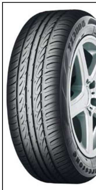
Firestone har kommit med det nya touringdäcket TZ300a för personbilar som gradvis kommer att ersätta TZ200-modellen.

Det nya däcket finns till en början i 14 dimensioner från 14 till 16 tum.