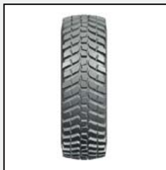
Alliance har kommit med ett nytt traktordäck

– Däcket ingår i Alliance stora satsning där man i fjol och i år lanserar totalt 144 nya produkter. De