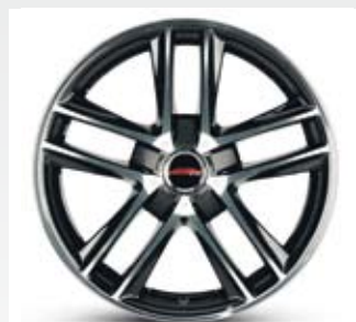
Oxso Bond levereras med svart kåpa. Men det finns också i rött och gult. Fälgarna finns i 17, 18, 19 och 20 tum.

Idag har Amring lager för fälgar i Göteborg och Strängnäs. Det tidigare lagret i Vimmerby avvecklades i fjol.