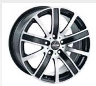
Denna svartpolerade fälg kommer från Autec och finns i 17, 18 och 20 tum och finns endast med fem hål.

Det World of Wheels marknadsför är aluminiumfälgar från de tyska företagen Autec och Borbet.