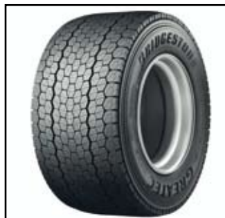
Bridgestone har kommit med andra generationen singeldäck för lastbilar drivaxel. Det är Greayec Mega Drive M709.

Bridgestone anser att singeldäcket ska kombineras med lufttrycksmätaren TPMS som hela tiden ger chauffören information om rätt lufttryck och varnar om det uppstår något luftläckage i däck. Samtidigt