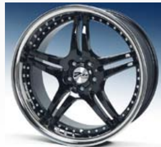
Zito Titan är en svart fälg med rostfri kant och finns i 17, 18 och 19 tum.