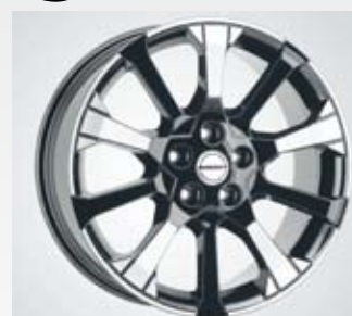
Borbet X10 är en tioegrad fälg i en speciell design i bicolour finish och finns i 17 och 18 tum.