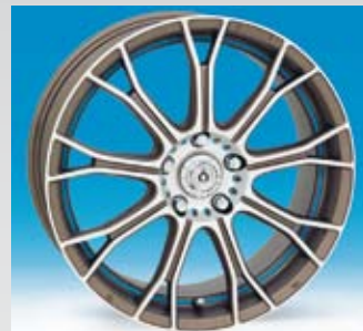
König Capricom är i matt brons med matt polerad front. Finns i 17 och 18 tum.