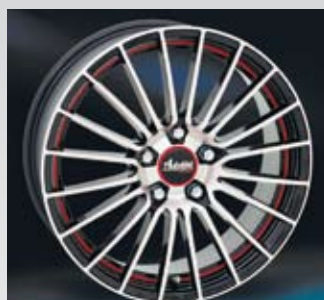
Advanti Touring är en helgjuten fälg som är blank svart med röd kant och polerad front. Finns i 16 till 18 tum.