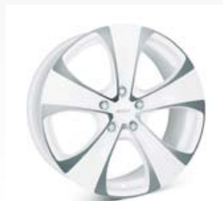
Alutec Dynamit White är enligt namnet en vit fälg som endast finns i 18 tum.