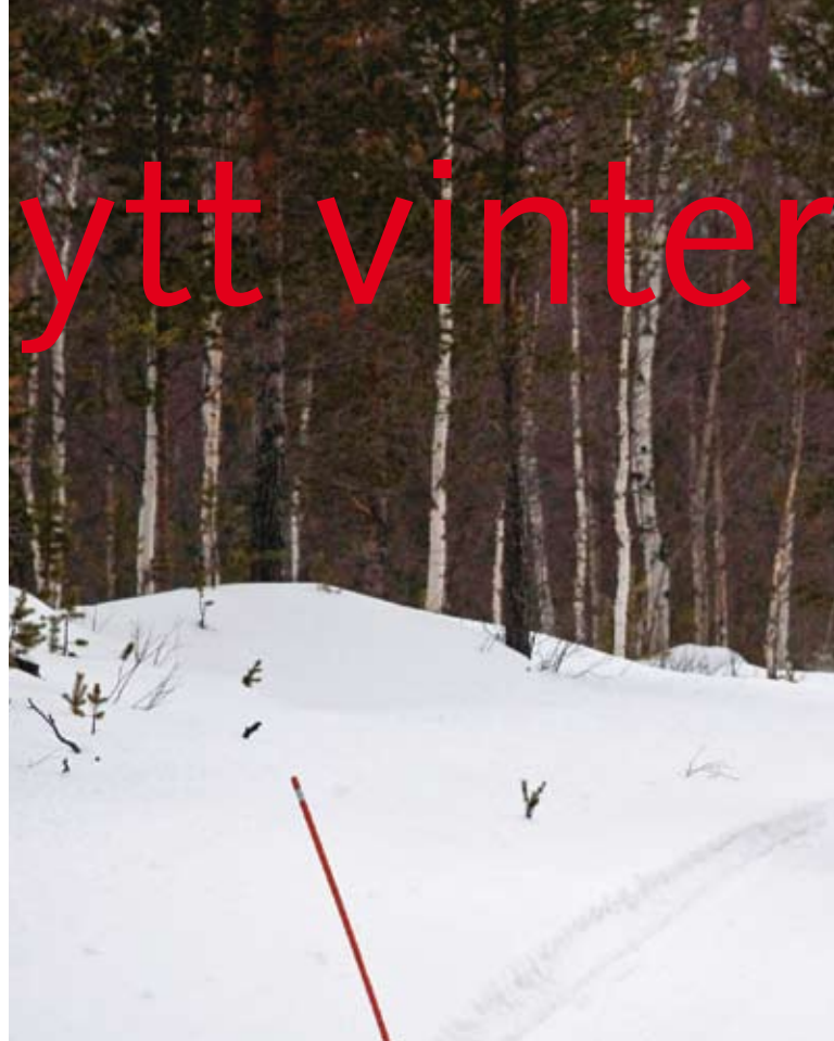
Konkurrensen och marknaden har utökats för dubgade vinterdäck. Det har fått Michelin X-Ice North är i princip ett helt nytt däck.

De centralt placerade mönsterblocken är designade för grepp i