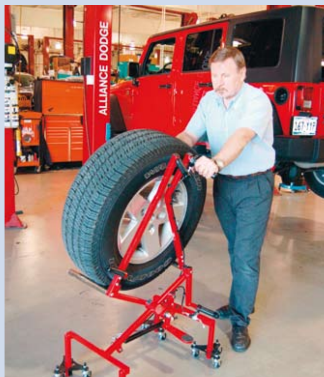
Däcklyften Wheelfloat är ett hjälpmedel för att klara de tunga däcken som finns till exempel på SUV-bilar vid montering och balansering.

– Intresset har varit stort när vi har presenterat lyften ute på däck- och bilverkstäder då beställningsskador har blivit allt mer uppmärksammat och svarar också för 40 procent av alla anmälda arbetsskador, framhåller Elgestål. Fördelarna med lyften har uppmärksamats av motorbranschtidningen Motor Magazine som har tilldelat den utmärkelsen Top 20 Award 2007.