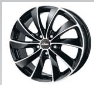
Lugano kommer från Rial i färgen diamond black och finns i 16, 17 och 18 tum.

— Vi har också billigare fälgar med tunnare gods avsedda för miljöbilar då de inte väger så mycket.