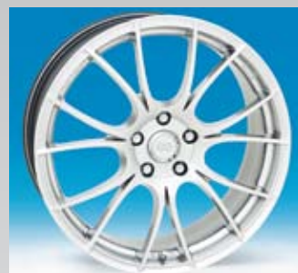
Enkei Katana är en fälg i hypersilver. Finns enbart i 18 tum.