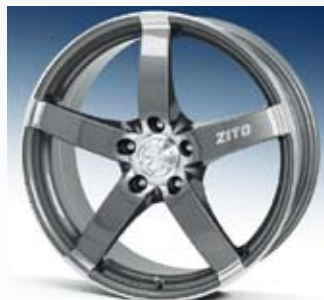
Zito Navarro har polerat centrum och på ytterdelen av ekrarna. I övrigt är fälgen grafitgrå. Finns i 17, 18 och 19 tum.