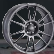
Matt Graphit Silver