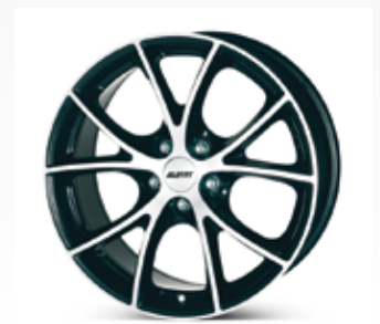
Alutec Cult är en svart färgad fälg med både tre och fem hål för att passa olika bilar. Finns från 15 till 18 tum.