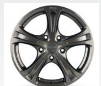
Oxso Soja är en svartfärgad fälg i 15, 16, 17 och 18 tum.