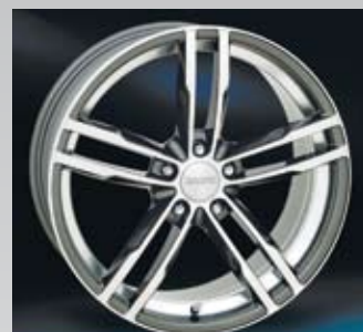
Nitro Max är en helgjuten fälg i gun metallic med polerad front. Finns från 17 till 20 tum.