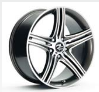
Från japanska Kosei kommer Hockenheim GP. Det är en helgjuten fälg med välvda dubbelekrar. Finns i dimensionerna 15, 16, 17 och 18 tum.

Bland företagets fälgleverantörer finns också Eiker som har specialiserat sig på fälgar till lite äldre bilar som Volvos 140-serien eller 200-serien och 700-serien.