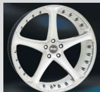
Advanti Shade är en helgjuten fälg i mirror silver och finns från 17 till 22 tum.