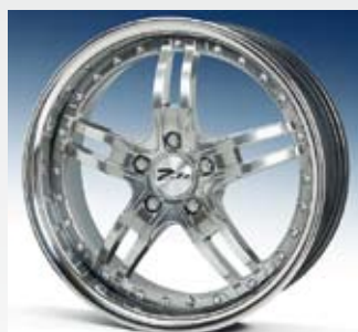
Zito Impala har fått ny lack med mycket lyster och har rostfri bana. Finns i 18 och 19 tum. På bakhjulet har fälgen hela 60 mm fälgkant.

– Det intressanta är dock hur marknaden kommer att utvecklas i vår, tillägger han.