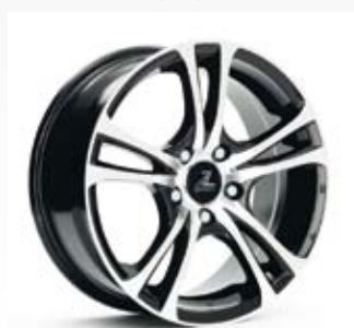
Fälgerna Drift kommer från AZ Sport och har också fem dubbelekrar i samma svarta nyans som fälgbanan. Finns i 13, 14, 15, 16 och 17 tum.